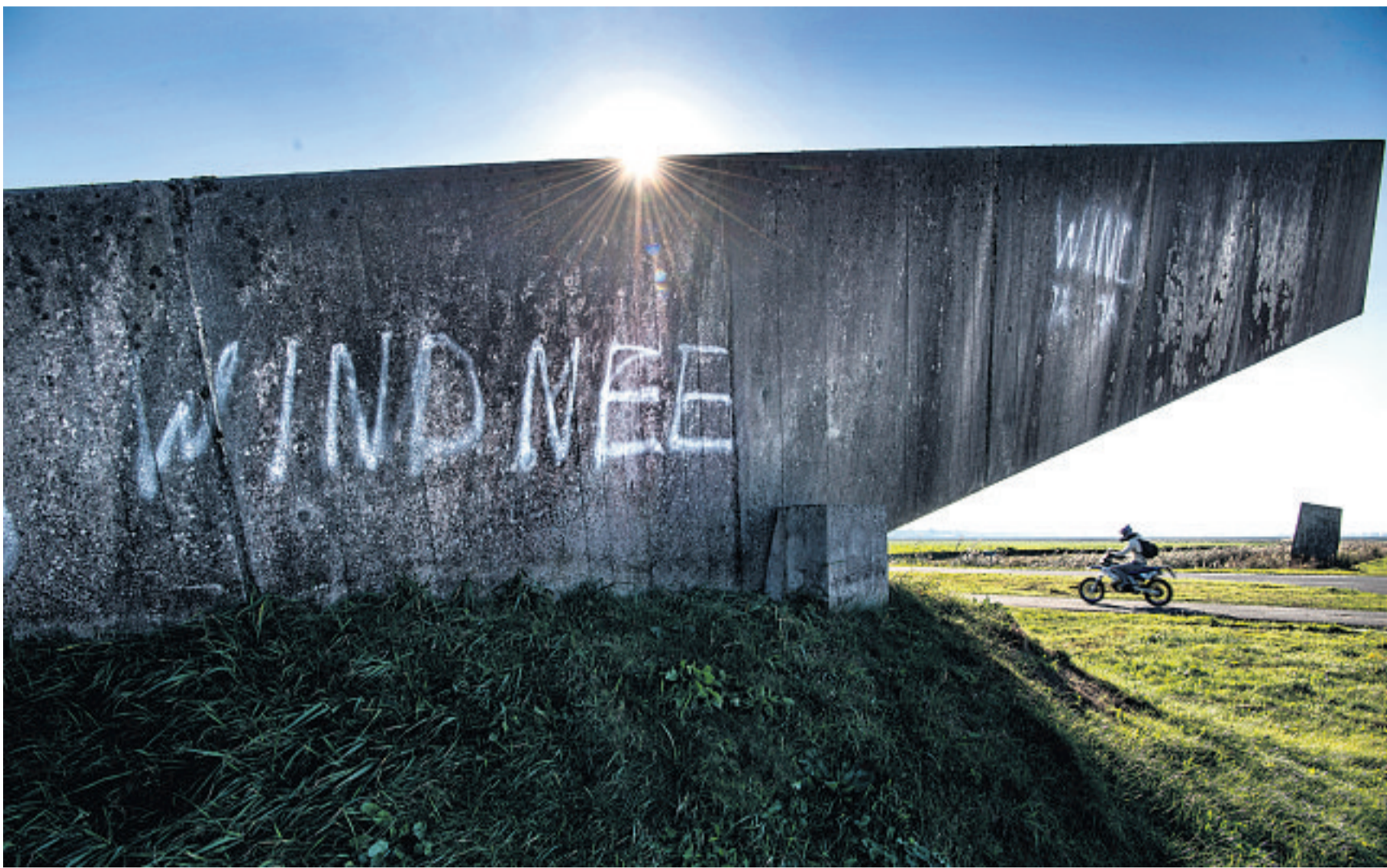
De initiatiefnemers lokken met hun 'maximum-aanpak' bijna uit dat mensen boos worden, zegt een hoogleraar.