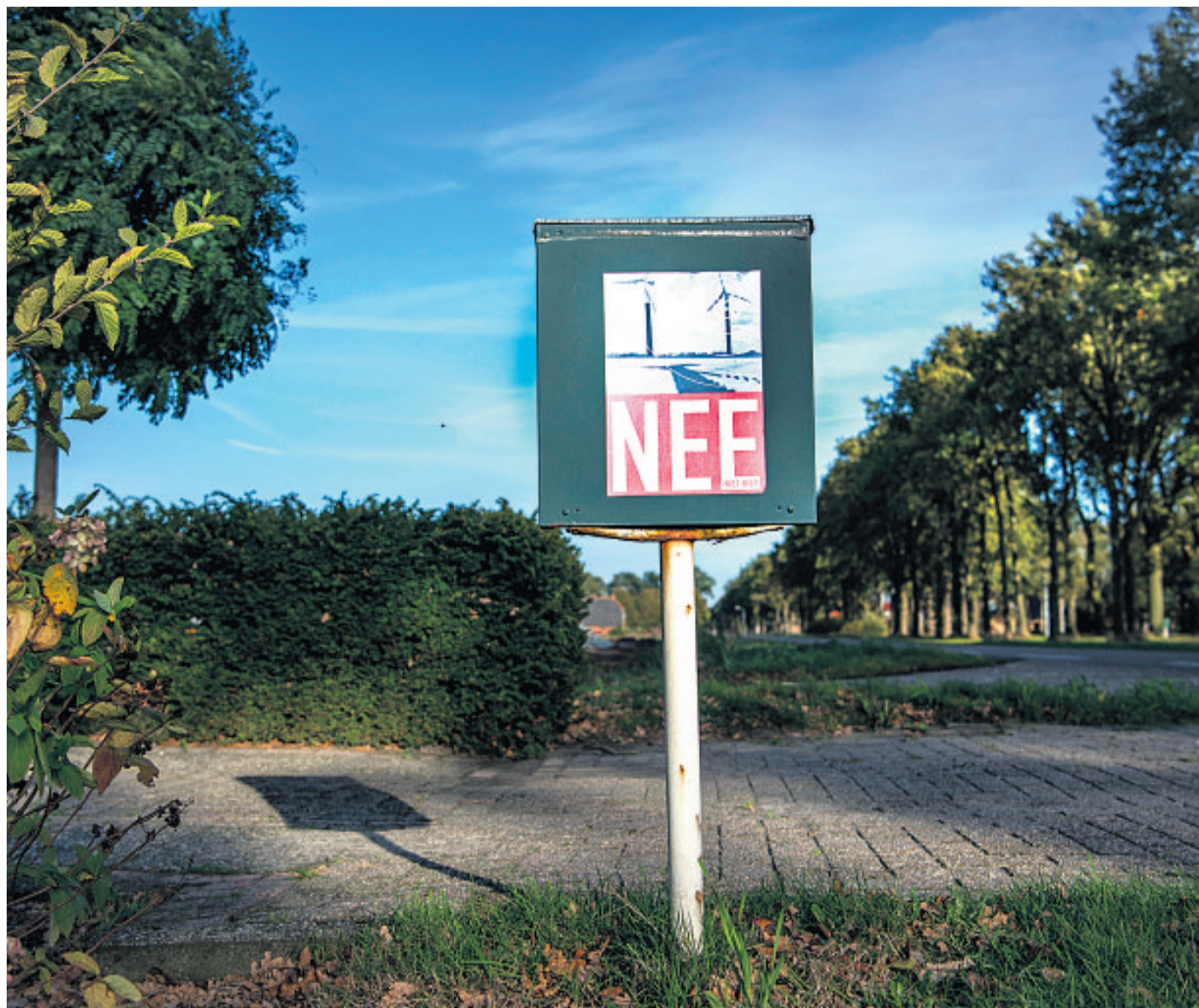
Uiting van verzet in Eerste Exloërmond

Een windturbine kan een boer jaarlijks zo'n €80.000 opleveren, schreef dagblad Trouw twee jaar geleden. Er zijn boeren die