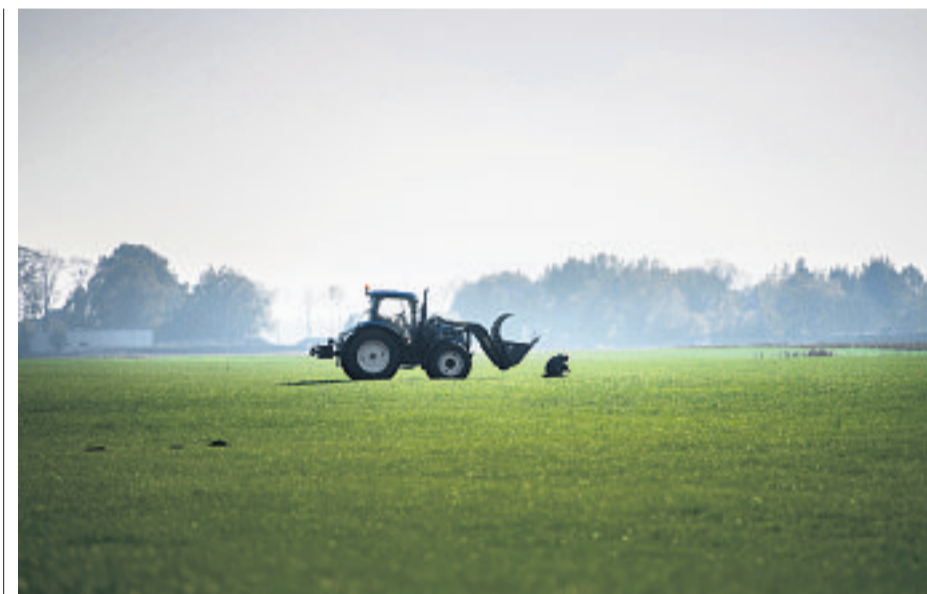
Een tractor op het land. Op deze velden komen windturbines van 210 meter.

Jasje, stropdas, smetteloos witte blouse: van vrijwel accentloos Nederlands schakelt hij moeiteloos over naar het plat van