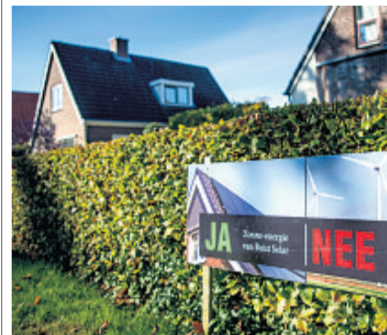
Wél zonnepanelen, geen molens

Het gemiddeld inkomen per inwoner ligt in Stadskanaal op €19.400, waarmee het de op een na armste gemeente van de